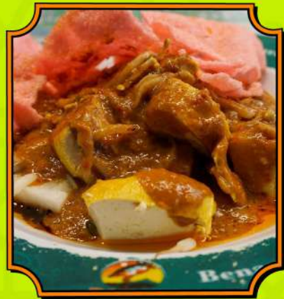
Kupat Tahu Gempol Kupat tahu dengan kondimen paling lengkap.