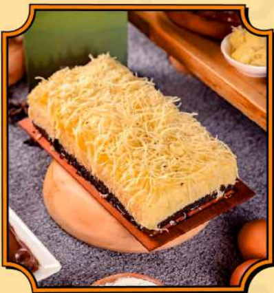
Bolu Susu Lembang Bolu lembut favorit.