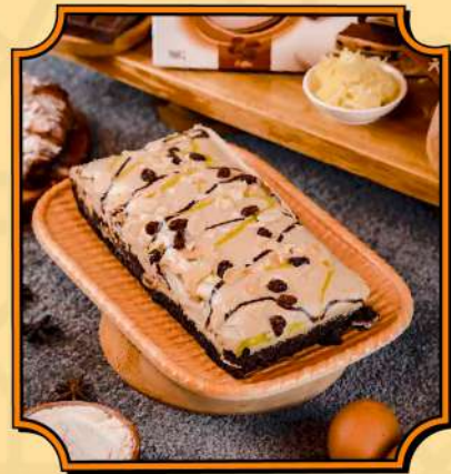
Brownies Amanda Brownies legit rasa kekinian.