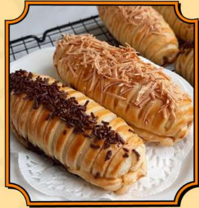
Bolen Lilit Bolen renyah di luar, lembut di dalam.