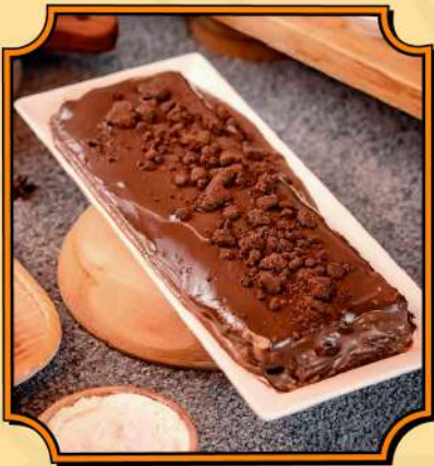
Tiramisusu by Chocomory Tiramisu berbalut coklat yang melimpah ruah.

Bawa pulang cita rasa Bandung kemanapun kamu berada.