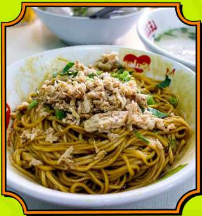
Mie Baso Linggarjati Pilihan mie dan bakso yang nggak pernah salah.

Dijamin, bikin kamu gagal move on sama rasanya!