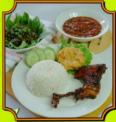
Warung Nasi Bu Imas Makanan khas Sunda yang ngangenin.