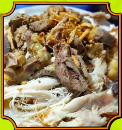
Bubur Gibbas Bubur dengan topping yang melimpah.